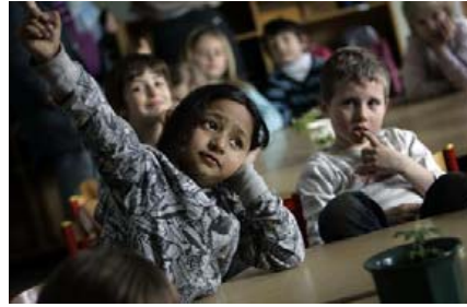
Arkivfoto: Finn Frandsen

Kilde: Folkeskoleafgangsprøve i engelsk 2012. Kvalitets- og tilsynsstyrelsen, Ministeriet for Børn og Undervisning.