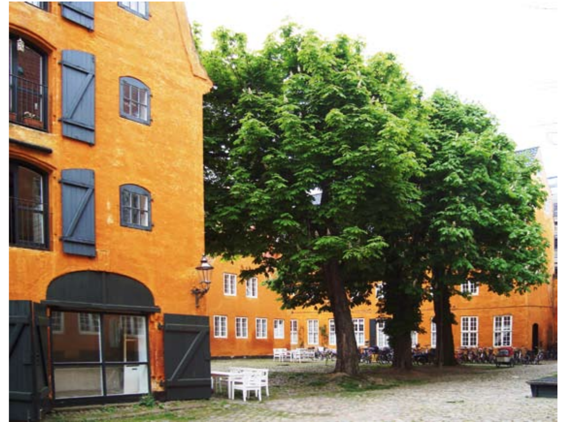
I Irgens Gård, hvor der var kaserne for artilleriet i sin tid, startede skolen for underofficerernes børn.

Den røde Bænk foran Inspektørens kontor.