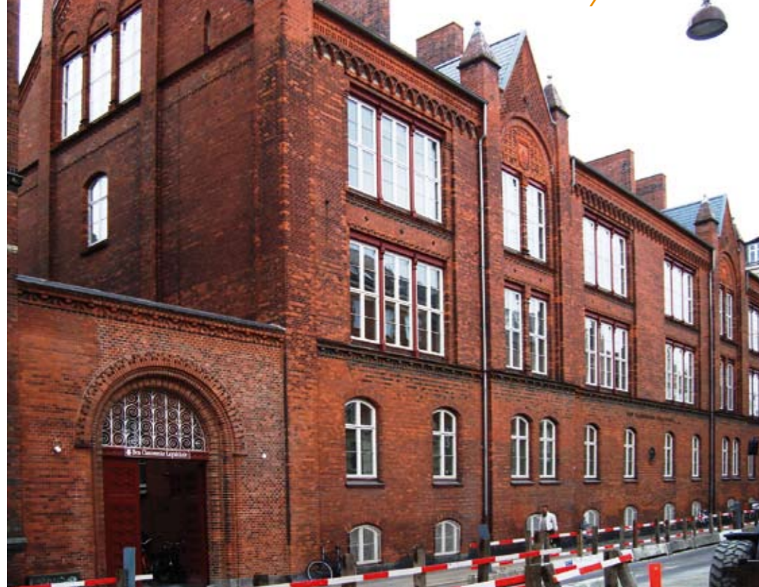
Skolen som nu ligger i Vestervoldgade