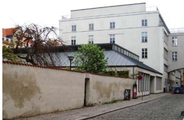
Her i Wildersgade lå skolen i en del år.

Den gamle kaserne i Vester Voldgade benyttede skolen under kigen, da tyskerne tog selve skolen til tyske flygtninge.